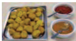
наггетсы с Dip-соусами Буффало, Манго и Джалапено