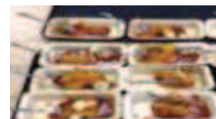
колбаса Карри с соусами Манго-Чатни, зеленым карри и попкорном